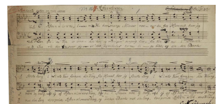
Bildet viser begge håndskrift og signatur.