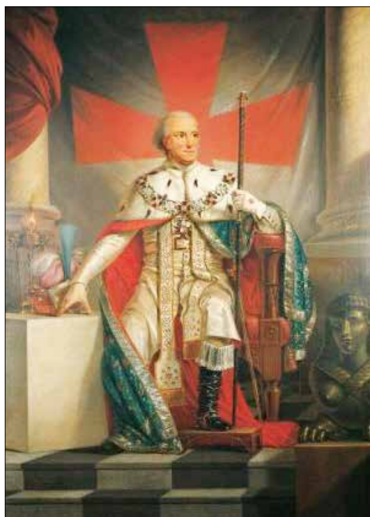
Hertug Carl av Södermanland

Dagens ritualer forteller en dramatisk historie. Men hvor kom de fra? De ble ferdigstilt av Hertug Carl av Södermanland den senere kong Carl XIII av Sverige i 1801. Men hva med ritualene fra før den tid? Ritualer fra før 1801 er av stor verdi for frimurerforskere. Ved å analysere gamle ritualer kan vi danne oss et bilde av hvordan og hvorfor ritualene har utviklet seg som de gjorde.